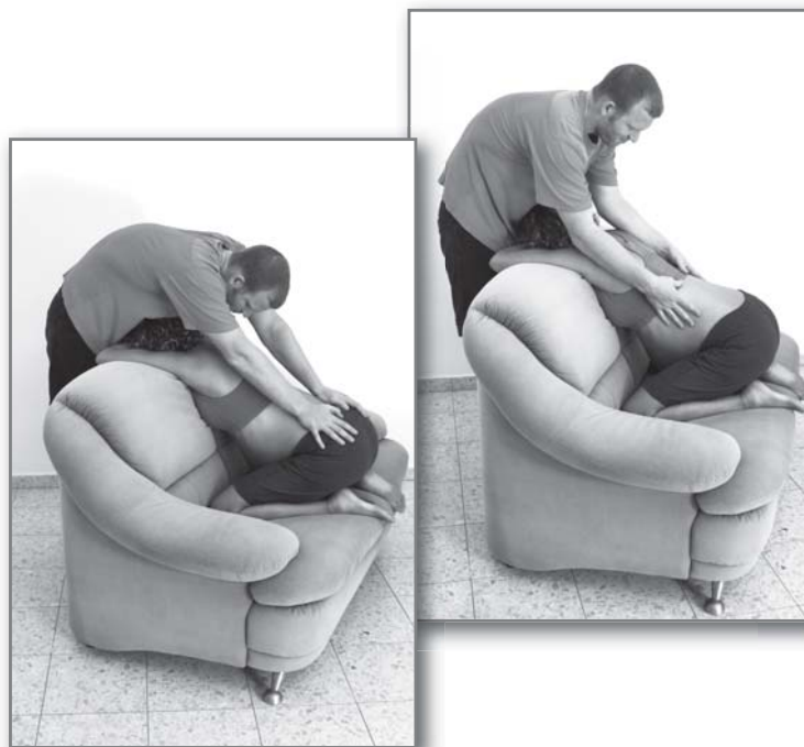
עיסוי לאורך הגב - מהשכמות עד האגן, בתנועות איטיות וארוכות

ישיבת עקבים על מושב הכורסה/ספה, הפנים למשענת, פלג הגוף העליון נשען עליה בן הזוג עומד מאחורי המשענת, פניו לאישה