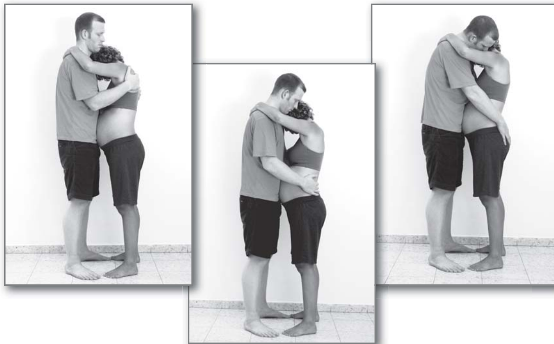
עיסוי לאורך כל הגב (מהאגן עד השכמות) בתנועות ארוכות, הידיים פועלות יחד מעלה ומטה או בכיוונים מנוגדים - יד אחת מעלה והשנייה מטה